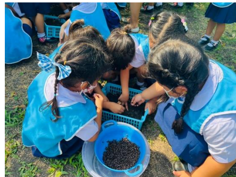
กิจกรรมเกษตรกรตัวน้อย เพาะต้นอ่อนทานตะวัน